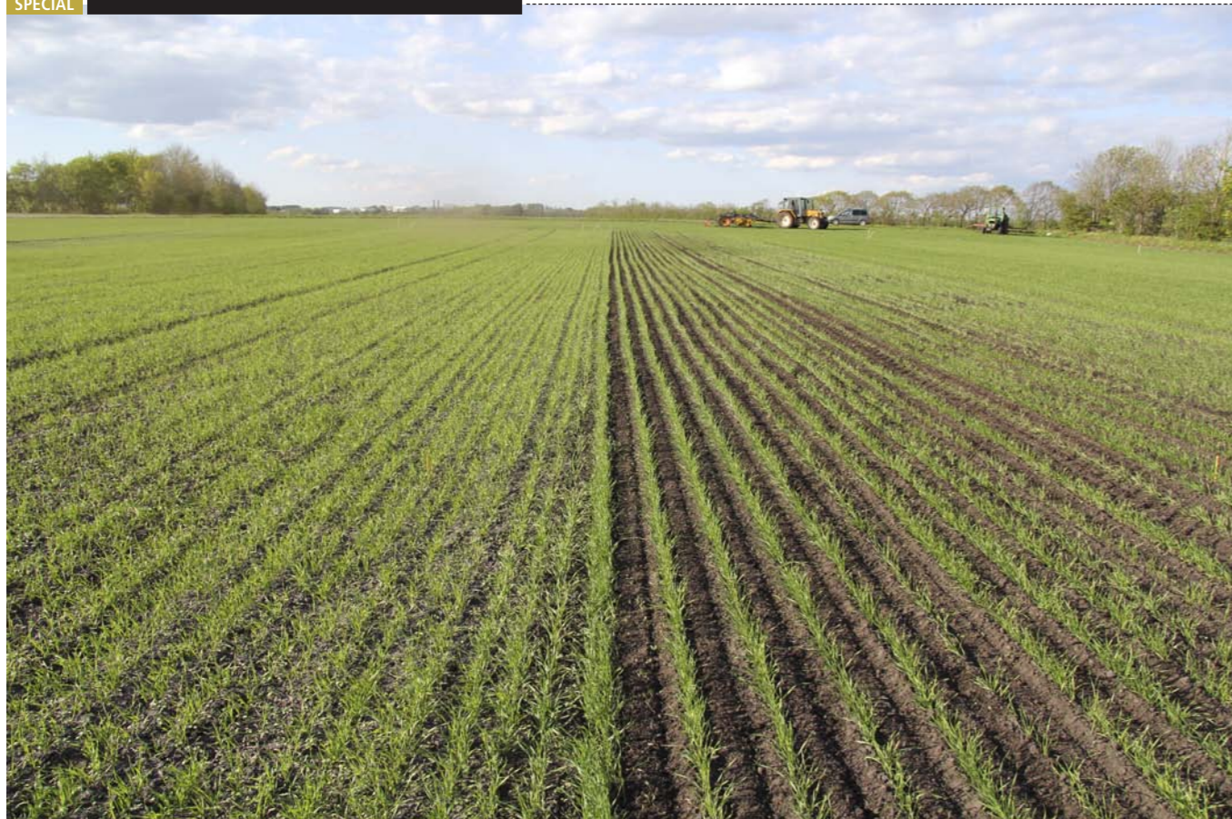
Forsøg med radrensning i vårhvede. Til venstre ubehandlet på 12,5 cm rækkeafstand og til højre